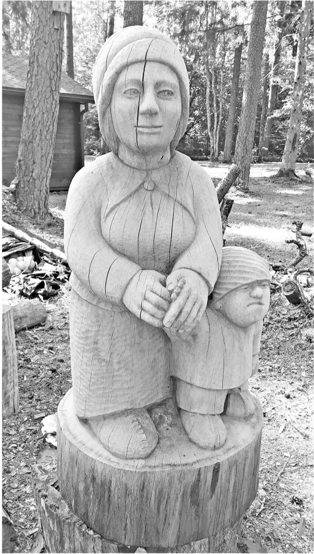
Viena no jaunākajām koka skulptūrām – Rūķene ar mazo Rūķenu.