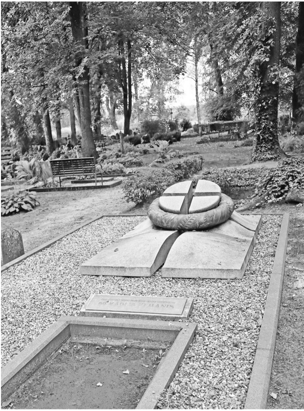
Kārļa Ulmaņa piemiņas vieta.