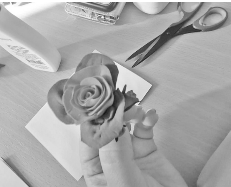
Meistarklasē izveidotais polimērmāla zieds.

ar jaunākajām atvasēm, kas paņemtas līdzī. Tādā veidā arī cenšos piesaistīt jaunus lasītājus, lai viņi šeit jūtas gaidīti. Tāpat arī tie cilvēki, kuri strādā līdz sešiem vakarā un brauc no darba mājās, var izmantot šos pagarinātos vakarus, lai ienāktu samainīt lasāmvielu.