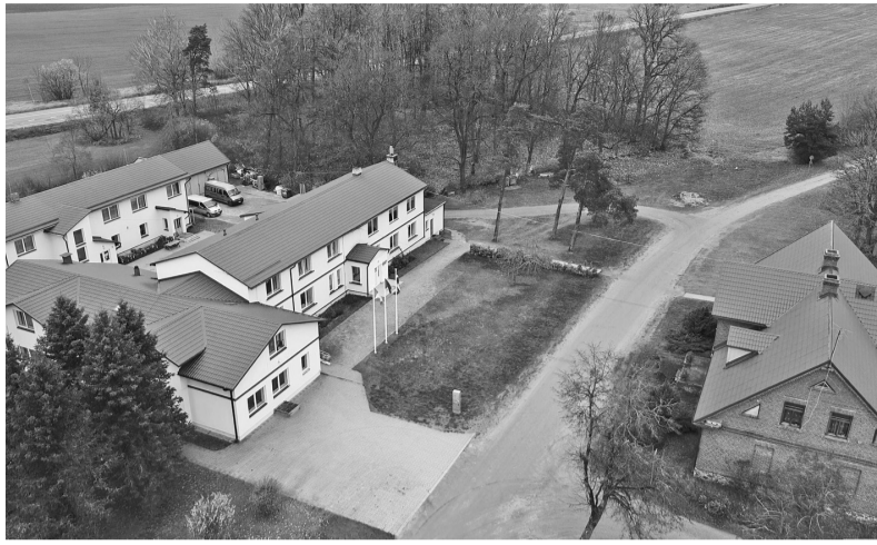
Bērzupes speciālā pamatskola no putna lidojuma.

- Precīzu skaitu nosaukt nevaru, jo tas ik pēc brīža mainās, vēl pa kādam bērnam piepulcējoties. Uz šo brīdi Bērzupē ir 72