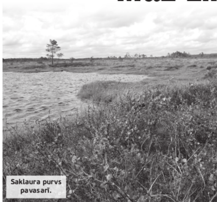
Saklaura purvs pavasarī.

Purvi ir nozīmīga Latvijas ainavas sastāvdaļa un sastopami visā Latvijas teritorijā. Purvi aizņem aptuveni 5% teritorijas (platības ar kūdras slāni ir lielākas, ap 10%, taču ne visas uzskatāmas par purviem), bet tiem ir liela nozīme dabas daudzveidības saglabāšanā. Lielākie purvi ir valsts īpašums, tos apsaimnieko Dabas aizsardzības pārvalde vai AS "Latvijas valsts meži", mazie purvi bieži vien ir privātīpašumā. Gandrīz visi augstie un pārejas purvi ir Eiropas un Latvijas aizsargājami biotopi.